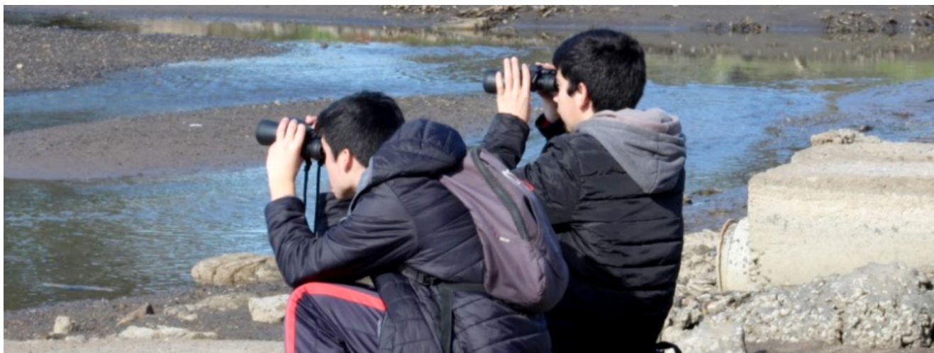
Figura N° 3. Estudiantes realizando monitoreo en el sitio de estudio.

nidad de aves presentes en el humedal, datos que fueron usados para determinar el índice de diversidad de Simpson, que indica la probabilidad de encontrar dos individuos de especies diferentes en dos 'extracciones' sucesivas al azar sin 'reposición'. Este índice le da un peso mayor a las especies abundantes subestimando las especies raras, tomando valores entre '0' (baja diversidad) hasta un máximo de [1 - 1/S] y el índice de Shannon-Wiener, que expresa la uniformidad o equitatividad de los valores de importancia a través de todas las especies de la muestra. Este índice se mueve de 0 a 4,5, y toma valor cero cuando se tiene tan solo 1 especie, es máxima si todas las especies tienen la misma cantidad de individuos (abundancia). Adicionalmente se clasificaron las especies residentes como migratorias.